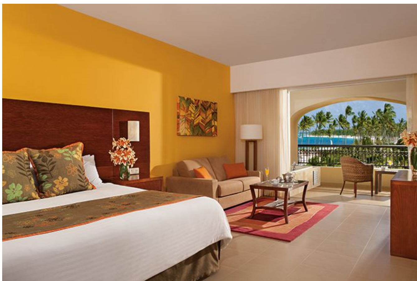
Now Larimar Punta Cana