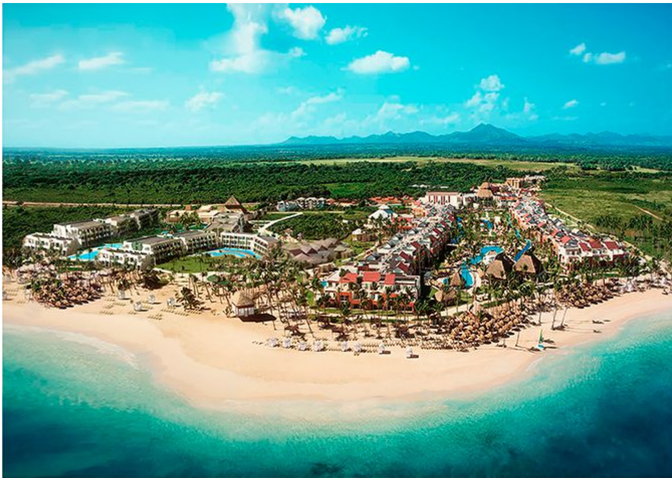
Now Onyx Punta Cana