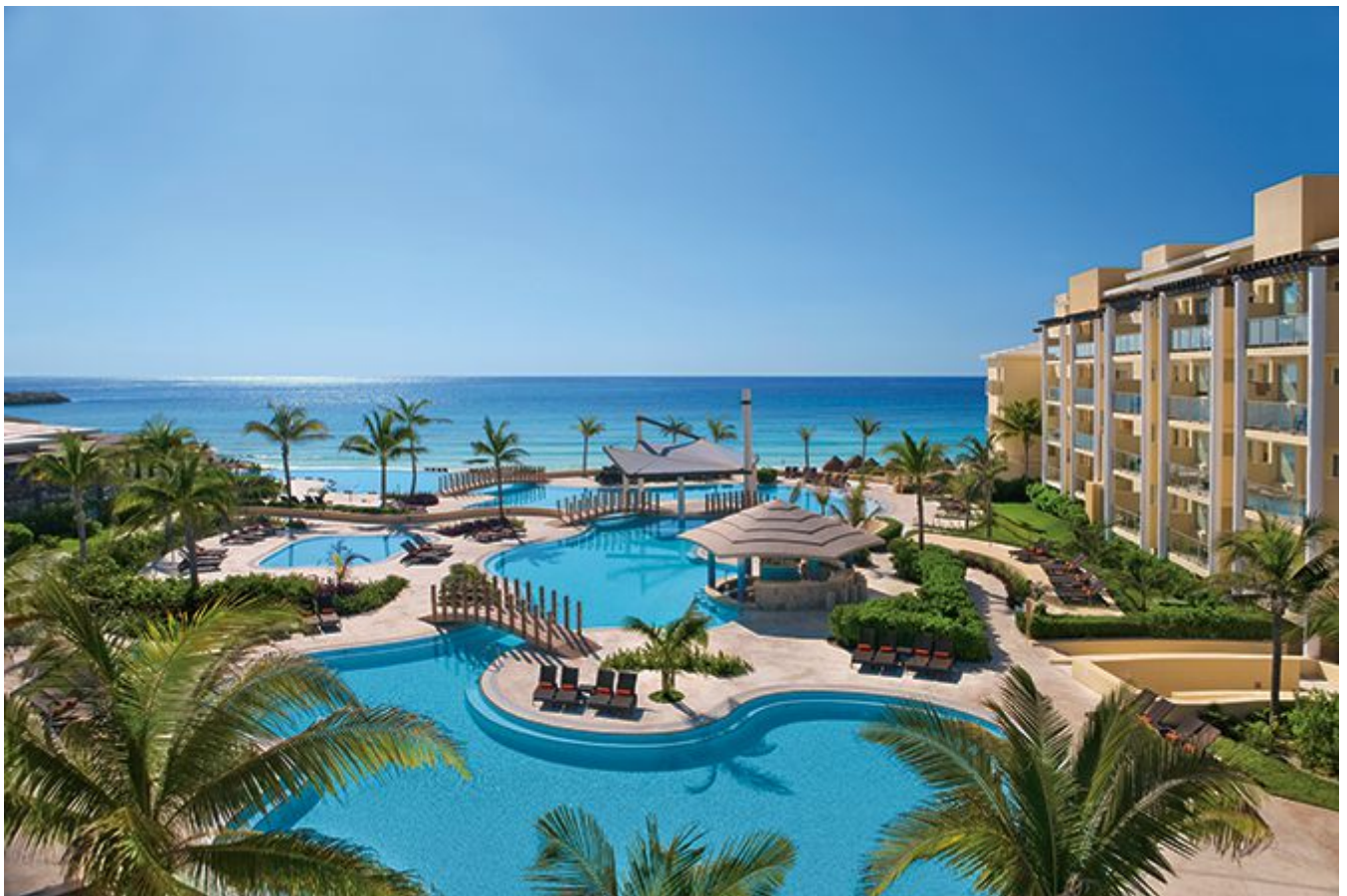
Now Jade Riviera Cancun